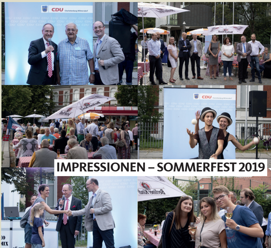
IMPRESSIONEN – SOMMERFEST 2019